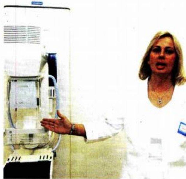
Najmoderniji mamograf na poliklinici

poslovnica i podružnica, te gotovo milijarda KM prihoda lani, uz više od milijun korisnika usluga, na najbolji način govore o značaju njegova prisustva u BiH. Svi smo svjesni teške ekonomske situacije u našoj državi, te nezadovoljni tempom ekonomskog razvitka i rasta standarda života stanovništva. Zbog toga je svaki novi objekt i svako novo radno mjesto ohrabrenje i povećava naš optimizam za budućnost – kazao je Komšić. Presijecanjem vrpce novu poslovnu zgradu Agrama u je otvorio jedan od čelnika koncerna, Husnija Kurtović, a ta prilika iskorištena je i za uručenje donacije od 50.000 KM općini Novi Grad.