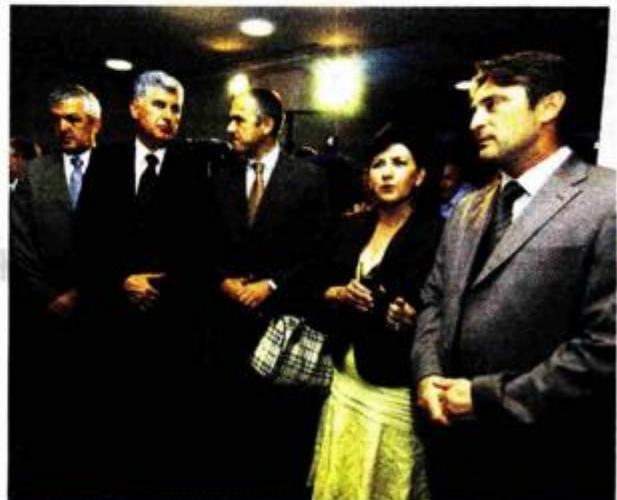
S lijeva na desno Dragan Vrankić dopremijer BiH, Dragan Čović predsjednik HDZ BiH, Nedžad Branković, premijer FBIH, Semiha Borovac gradonačelnica Sarajeva i Željko Komšić hrvatski član Predsjedništva